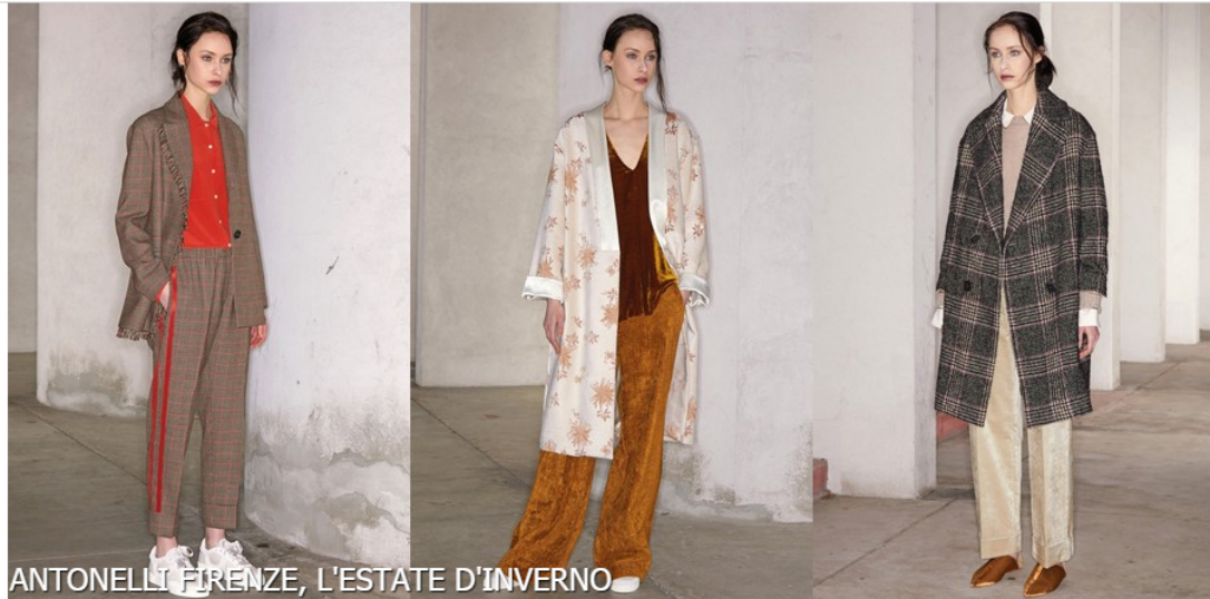
ANTONELLI FIRENZE, L'ESTATE D'INVERNO